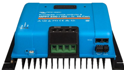
SmartSolar laddningsregulator: MPPT 250/100-Tr VE.Can utan skärm