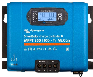
SmartSolar laddningsregulator: MPPT 250/100-Tr VE.Can med pluggbar skärm som tillval