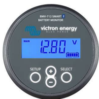
Bluetooth-avkänning: BMV-712 Smart Battery Monitor