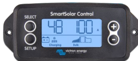
SmartSolar pluggbar skärm