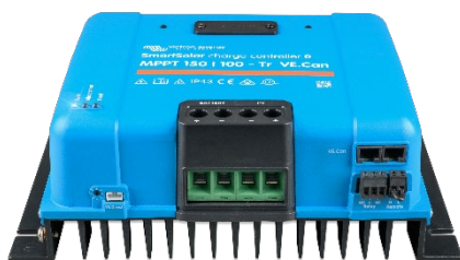
SmartSolar laddningsregulator: MPPT 150/100-Tr VE.Can utan skärm