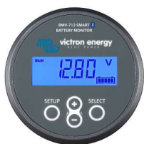
Bluetooth-avkänning: BMV-712 Smart Battery Monitor