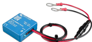
Bluetooth-avkänning: Smart Battery Sense