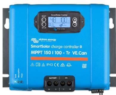
SmartSolar laddningsregulator: MPPT 150/100-Tr VE.Can med pluggbar skärm som tillval