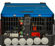
MultiGrid 2000 VA (bottenskydd borttaget)