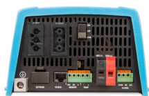
MultiPlus 500 / 800 / 1200 / 1600 VA