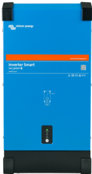
Växelriktare Smart 12/3000