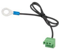
Kontakt med förmonterad DC-minuskabel (ingår)